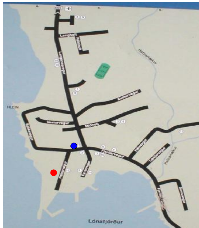
Mynd 1 Staðsetning fiskimjölverksmiðju og skrifstofu

Á mynd 1 má sjá hvar fiskimjölverksmiðjan er staðsett. Er það sýnt með rauðum hring. Skrifstofur H.Þ. eru sýndar með bláum hring.