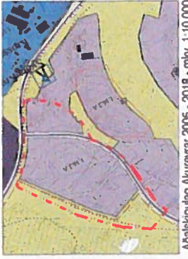
Adalskipulag Akureyrar 2005 - 2018 - mkv. 1:10.000

Deiliskipulagstillaga þessi sem auglýst hefur verið samkvæmt 1. mgr. 25. gr. skipulags- og byggingarlaga nr. 73/1997. frá 18. desember 2008. Aftugæmsdæfestur var til 29. júní 2009.